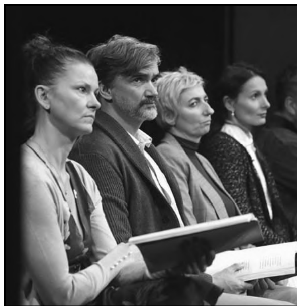
Vražda krále Gonzaga →