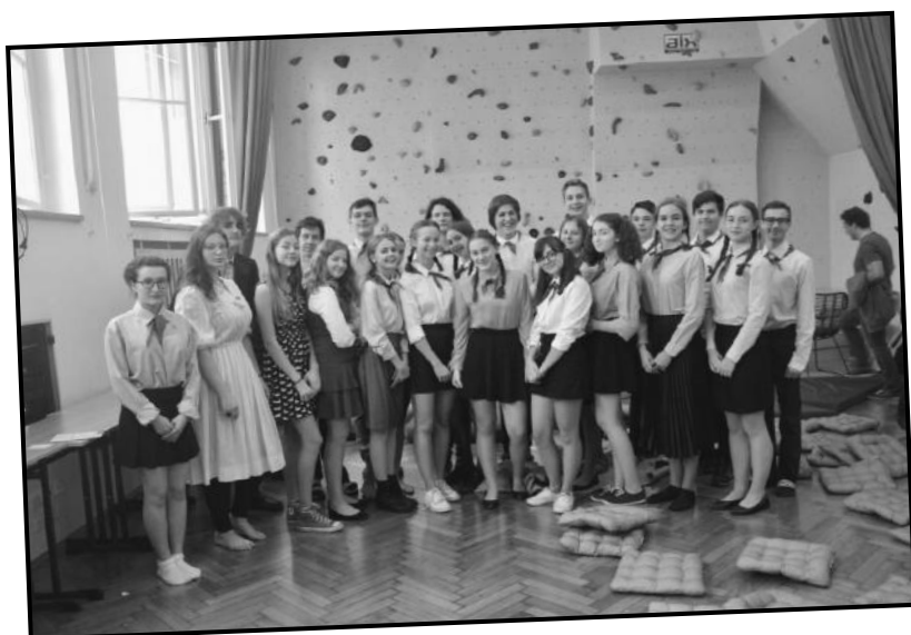
sto let republiky